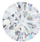
ФОТО ВНЕ МАСШТАБА