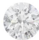
ФОТО ВНЕ МАСШТАБА