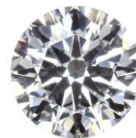
ФОТО ВНЕ МАСШТАБА